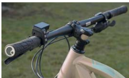
Řídítka by mohla být širší, ale jinak je kokpit perfektní.