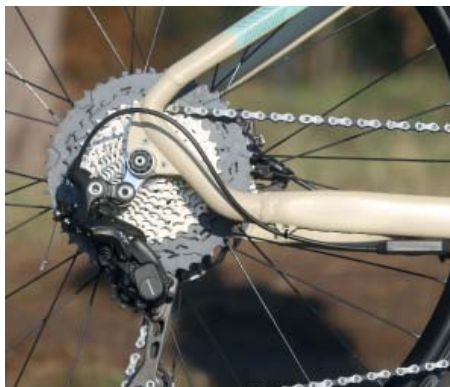
Pevná osa vzadu a přiznaná baterie na spodní trubce rámu.