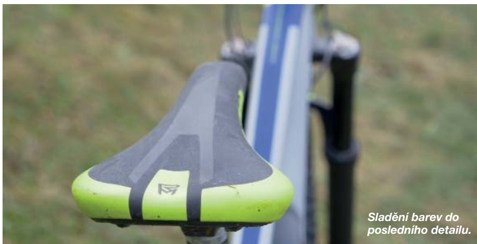
Sladění barev do posledního detailu.

J e prostě dobrý! Kdo? Nový sportovní e-bike od značky Rock Machine i nový středový pohon Shimano Steps E7000. S touto novinkou dostáváte v jednom balení nadčasově a moderní horské elektrokolo se svěžím designem a k tomu navíc perfektní motor, který vás vždycky bezpečně a spolehlivě podpoří, je tichý, úsporný a pracuje bez reptání i v nejtěžších kopcích.