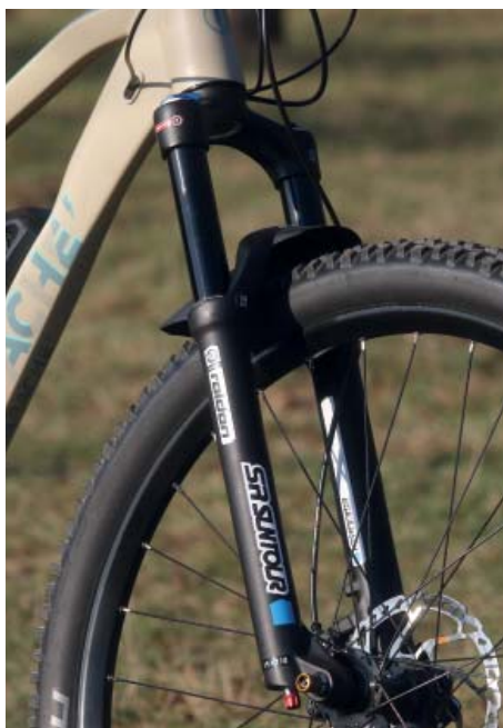
Vidlice Suntour pro náboj s pevnou osou.