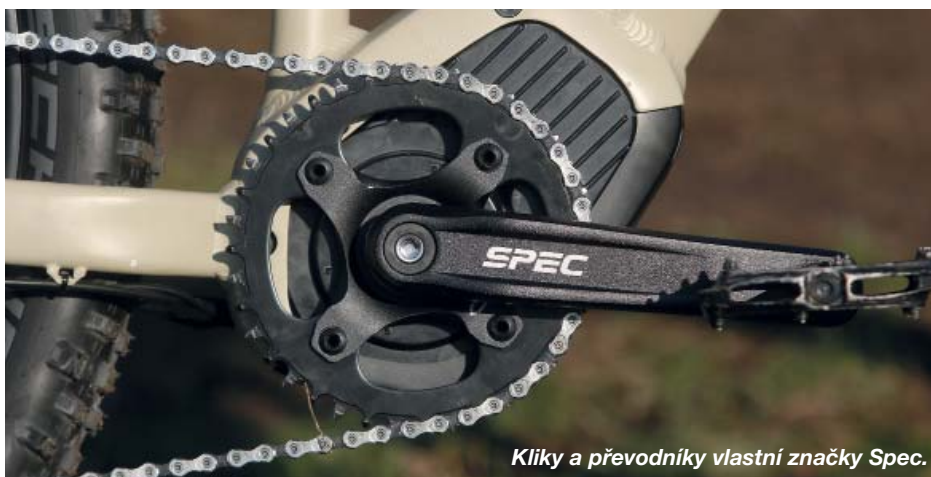
Klíky a převodníky vlastní značky Spec.

abyste zůstali bezpečně v sedle a sjeli vše, co je potřeba.