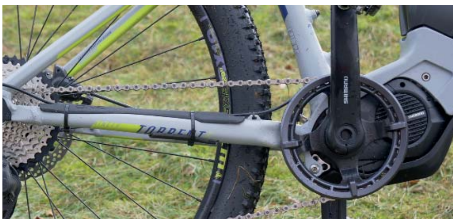
Nový pohon a řídicí soustava Shimano.